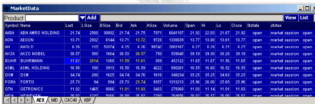
(vb1: Market data scherm)

In dit venster wordt de koersinformatie van een produkt getoond. Market data toont bijvoorbeeld de naam van het produkt, last(size), open, high, low, close, biedprijs, laatprijs, volume, stock state, etc.